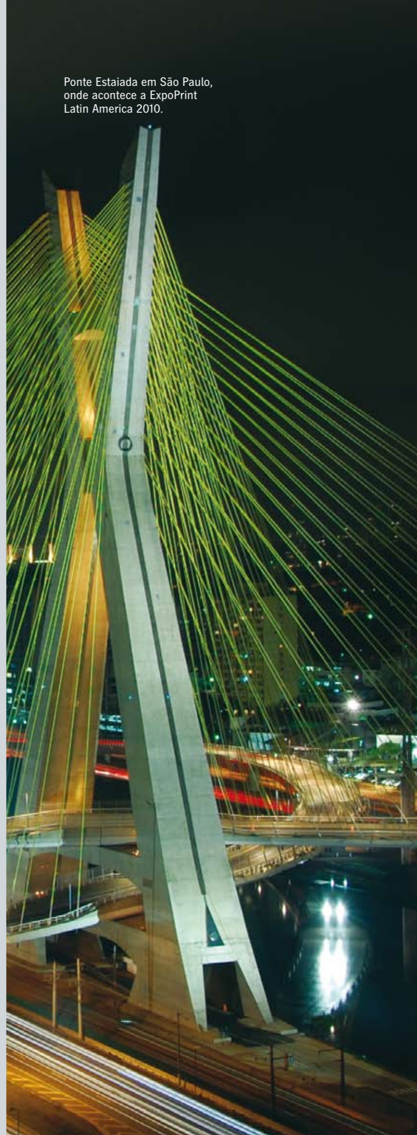
Ponte Estaiada em São Paulo, onde acontece a ExpoPrint Latin America 2010.